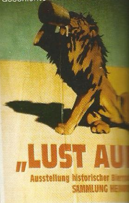
„LUST AU“ Ausstellung historischer SAMMLUNG NEHMEN

drinktec-interbrau Neue Messe München Öffnungszeiten: täglich während der Messe 3.00 - 18.00