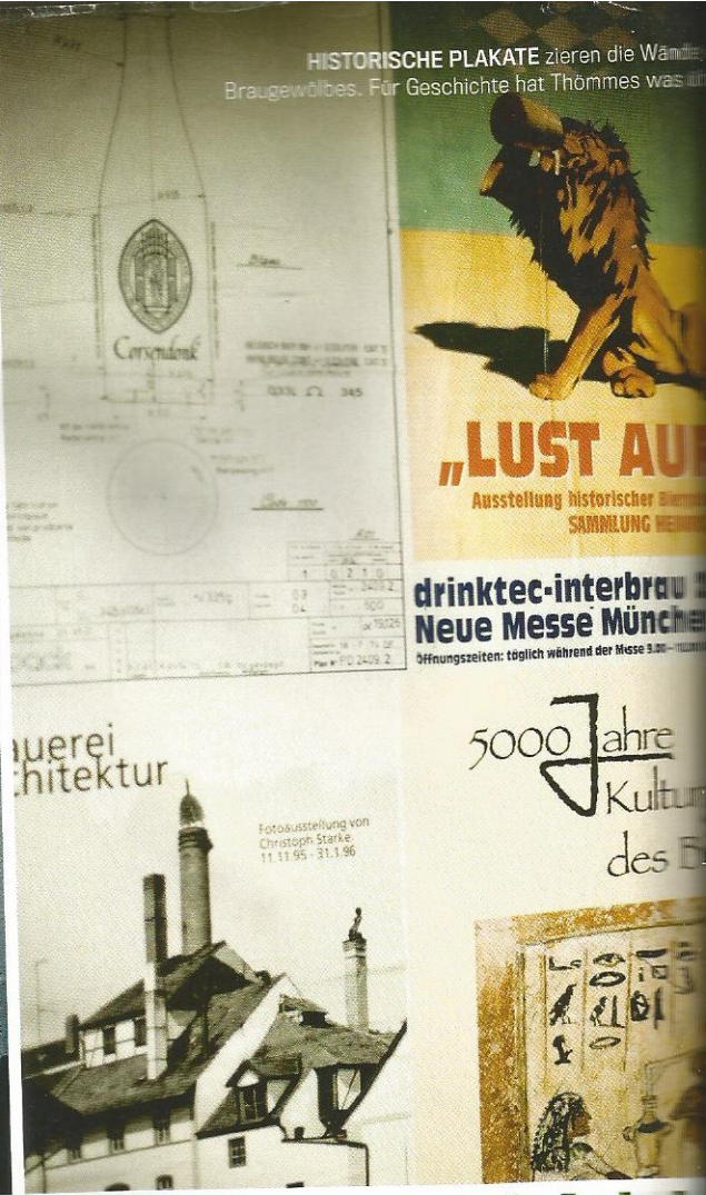
HISTORISCHE PLAKATE zieren die Wände des Braugewölbes. Für Geschichte hat Thömmes was.