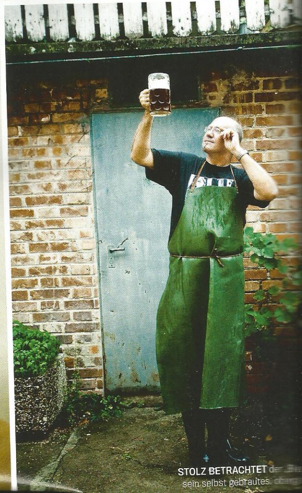
STOLZ BETRACHTET der sein selbst gebrautes